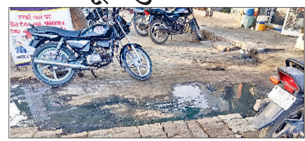
बगानीखेड़ा। कस्बे में सड़क पर जमा सीवर का पानी।

बगानीखेड़ा शहर के मुख्य बाजार में सीवरज व्यवस्था पूरी तरह से ध्वस्त हो चुकी है। ओवरफ्लो हो रहे मैनेहोल और सड़कों पर बहता गंदा पानी अब दुकानदारों और आमजन के लिए नासूर बन गया है। हालात इतने बदतर हैं कि बदबू और गंदगी के कारण दुकानदार सुबह देर से दुकान खोल रहे हैं और शाम को जल्दी बंद कर घर लौटने को मजबूर हैं। प्रशासन आखें मूंदे हुए नजर आ रहा है। कर्मचारी आते हैं, ककन उठाकर ढककर चलते दिखाई देते हैं।