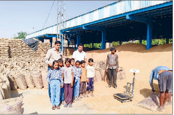
बाढ़ड़ा। अनाजमंडी का भ्रमण करते राजकीय प्राथमिक पाठशाला के विद्यार्थी।