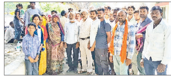
मिवाणी। शव गृह के आगे उपस्थित मृतक के परिजन।