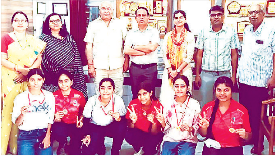
मिवानी। कॉलेज में आयोजित कार्यक्रम में उपस्थित प्राचार्य व अन्य।

यह बात वैश्य महाविद्यालय मिवानी की एन सी सी ईकाई द्वारा विश्व सृजनात्मकता एवं नवाचार दिवस के अवसर पर आयोजित पोस्टर मेकिंग प्रतियोगिता का