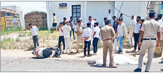
मिवाणी। हादसे के बाद मौके पर मृतक की स्कूटी व शव, जांच में जुटी पुलिस और हादसे के बाद पुलिस द्वारा काबू किया गया ट्रक।

घायलों की मदद करने की बजाय ट्रक चालक मौके से भागने की नियत से ट्रक को भगा लिया, जिसे दूसरे वाहन चालकों ने एक किलोमीटर तक पीछा कर पकड़ा। मिवाणी के