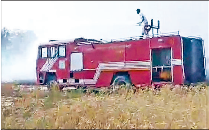
मिवाणी। खेतों में लगी आग को बुझाने और खेतों में खड़ी फायर ब्रिगेड की गाड़ी।

■ पास में काम कर रहे लोगों ने किसान को झुलसी हालत में तोशाम के निजी अस्पताल में दाखिल करवाया