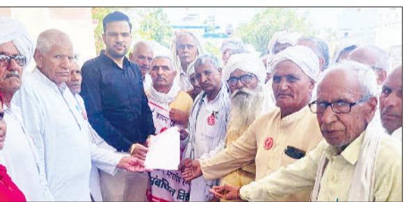
मिवानी। अधिकारी को ज्ञापन सौंपते रिटायर्ड कर्मचारी संघ के सदस्य।