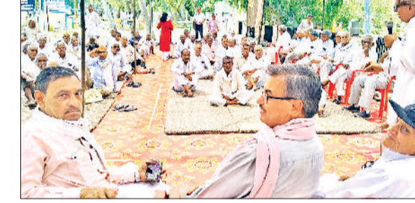
मिवानी। आयोजित कार्यक्रम में सेवानिवृत्त कर्मचारी संगठन के सदस्य।